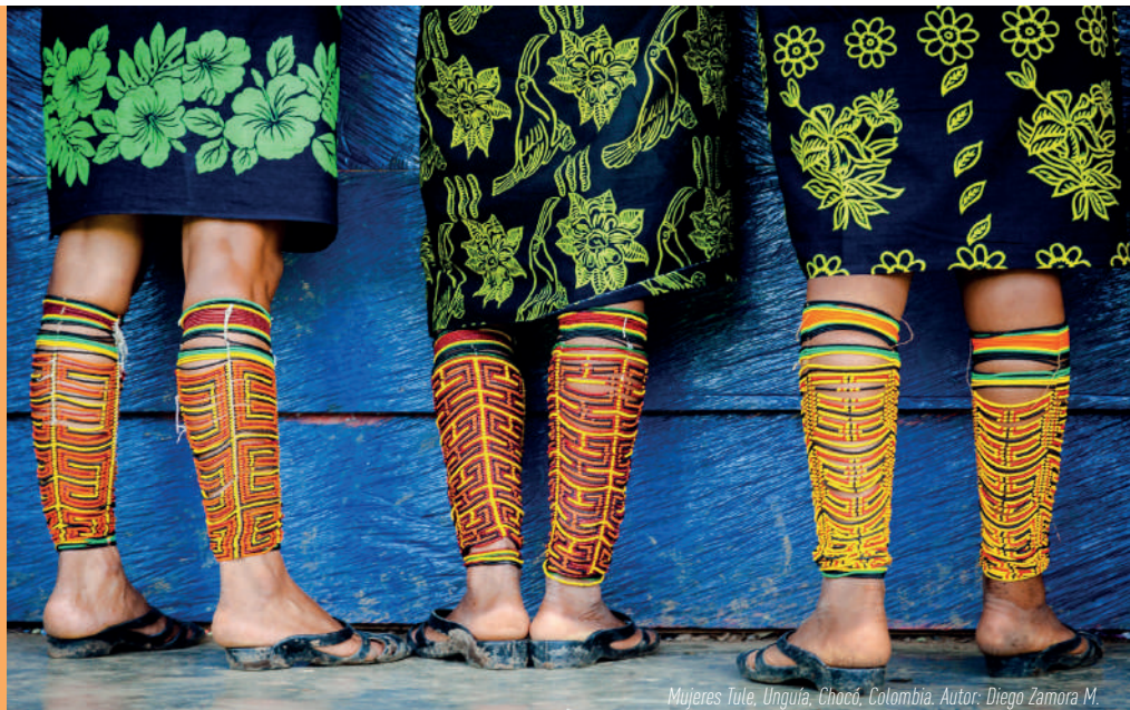
Mujeres Tule, Unguía, Chocó, Colombia.

La corrupción impacta en el desarrollo económico y social, el respeto por los derechos humanos, la confianza en las instituciones, el Estado de derecho, entre otros. Pero estos impactos no son neutros; estas consecuencias afectan de manera diferenciada a la población, por ejemplo, a las personas en situación de pobreza. Y tienen también una dimensión de género, como muestran tres ejemplos: