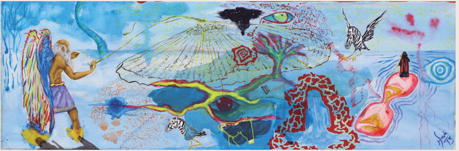
Andi Ochoa: La pesca de Ícaro , 2013 (Acrílico sobre lienzo, 100 cm x 90 cm)