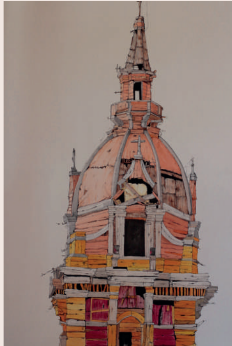
Raúl Ballesteros: Ciudad parapeto , 2019 (Acrílico sobre lienzo, 180 cm x 130 cm)