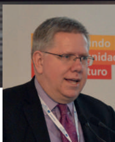
ANDREW SELEE | Presidente de Migration Policy Institute