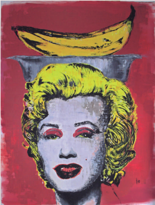
Giovanna Osorio: Ponchera Pop , 2019 (óleo sobre lienzo, 190 cm x 144 cm)