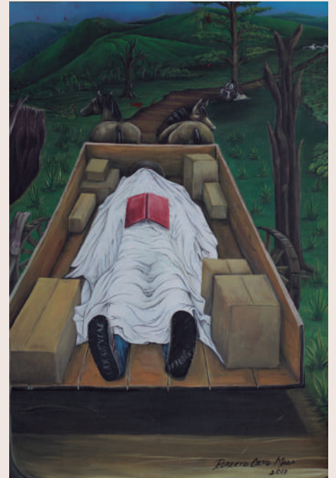
Roberto Ortiz Maza: ¿Y si me matan? , 2019 (Acrílico sobre lienzo, 124 cm x 94 cm)