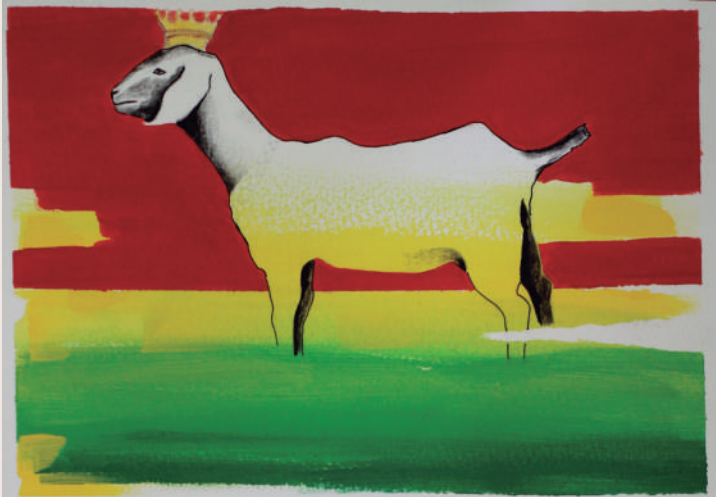
Alex García: La virgen de los sedientos , 2019 (Acrílico sobre papel, 200 cm x 100 cm)