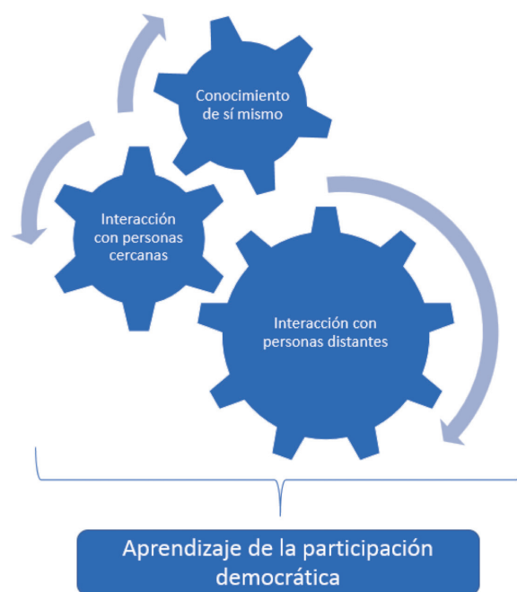
Organización general de las actividades

Es importante señalar que esta propuesta se entiende como flexible.