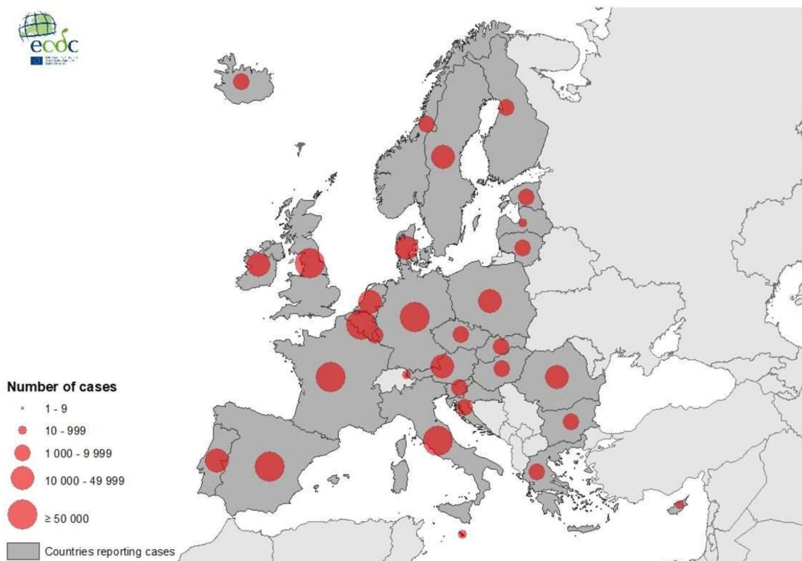
Date of production: 08/05/2020 The boundaries and names shown on this map do not imply official endorsement or acceptance by the European Union.

Todos los países han sido alcanzados, aunque en momentos y con intensidades diferentes